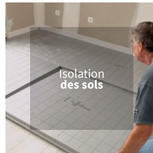
Isolation des sols