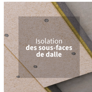
Isolation des sous-faces de dalle