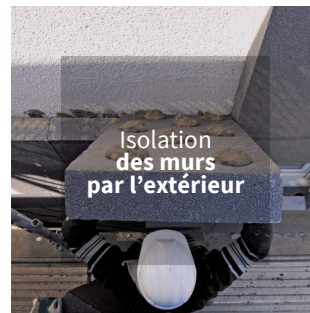
Isolation des murs par l'extérieur

Pionnier de l'innovation depuis l'introduction du PSE en France, nous avons l'ambition de créer pour nos clients les meilleurs produits et solutions . Aujourd'hui, nous lançons le PSE à empreinte carbone améliorée et travaillons déjà à d'autres évolutions.