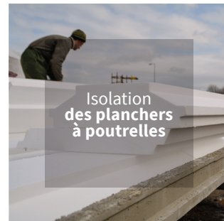
Isolation des planchers à poutrelles