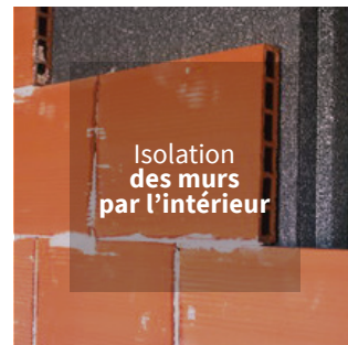
Isolation des murs par l'intérieur