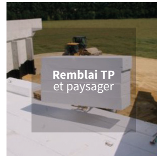
Remblai TP et paysager