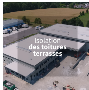
Isolation des toitures terrasses